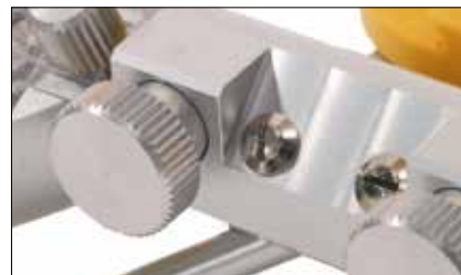
L'elevata qualità visibile e l'esatta lavorazione garantiscono lunga durata e precisione