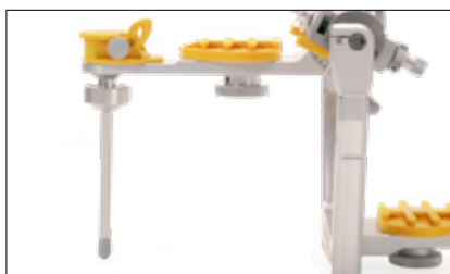
Antenna superiore con articolatore aperto