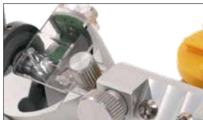
Calotta per ceste condilari