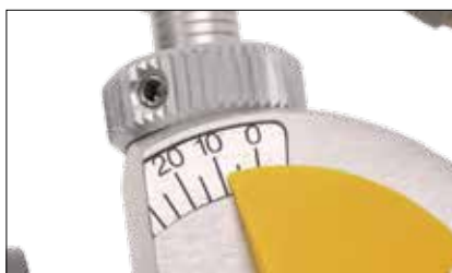
Impostazione dell'angolo di Bennett