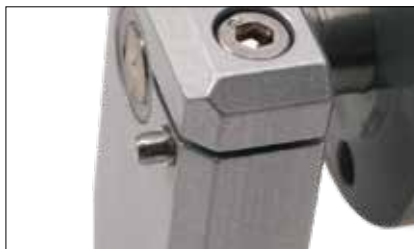
Perno di supporto per arco di trasferimento