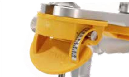
Accessori: piatto incisale regolabile