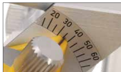
Impostazione del piano di guida