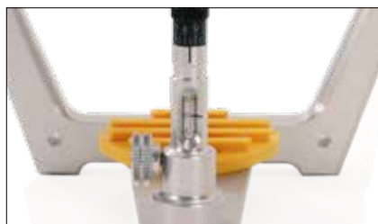
Accessori: asta incisale microregolabile