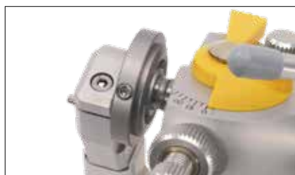
Bloccaggio della centrica con anello conico