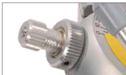
Protrusione (6 mm), retrusione (2 mm)