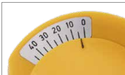
Impostazione dell'angolo di Bennett