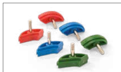
Accessori: guide di Bennett curve