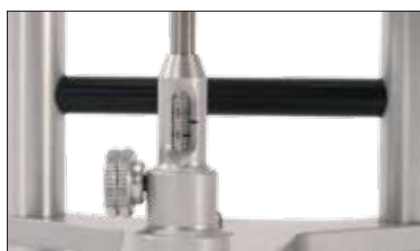
Asta incisale con scala millimetrata