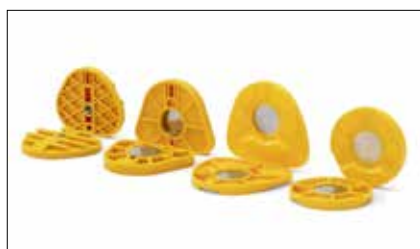
Basette di montaggio disponibili: MPS magnetiche o da avvitare (opzionale AXIOSPLIT®)