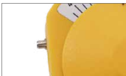
Perno di supporto per arco di trasferimento