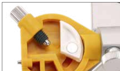
Bloccaggio della centrica con vite a molla