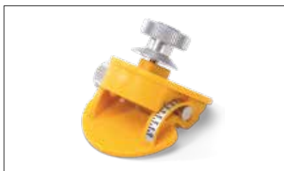
Accessori: piatto incisale regolabile