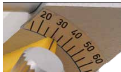
Impostazione del tragitto condilare