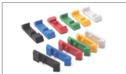
Accessori: inserti di protrusione 1 - 6 mm