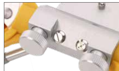
L'elevata qualità visibile e l'esatta lavorazione garantiscono lunga durata e precisione