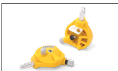
Accessori: ceste condilari a curvatura 2 e 3